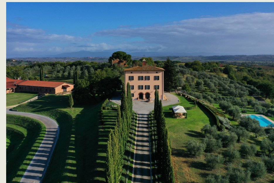
Relais Villa Grazianella | UNA Esperienze

UN GRANDE GRUPPO ITALIANO Il convergere di due culture aziendali.