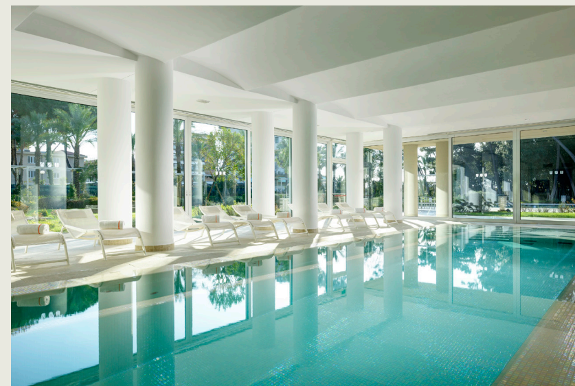
Versilia Lido | UNA Esperienze

La storia, le radici che affondano nel territorio e nella cultura, l'anima strettamente legata all'Italia: UNA Italian Hospitality è virtuosamente connesso al concetto di italianità, quella miscela unica di passione, emozioni, tradizioni, sapori, conoscenze, spirito, modi di essere e volontà di vivere tutto il meglio che da sempre contraddistingue il nostro Paese. Un ricco patrimonio che il brand importa nel settore dell'ospitalità, facendolo proprio e incarnandone le peculiarità. UNA Italian Hospitality è custode di quel mondo fatto di calore, gusto della vita e delle cose belle e buone. Il design, il buon cibo, l'arte, la cultura, le bellezze naturali, la convivialità e l'eleganza sono le colonne dell' Italian way of life che ogni ospite assapora nelle strutture della collezione UNA Italian Hospitality.